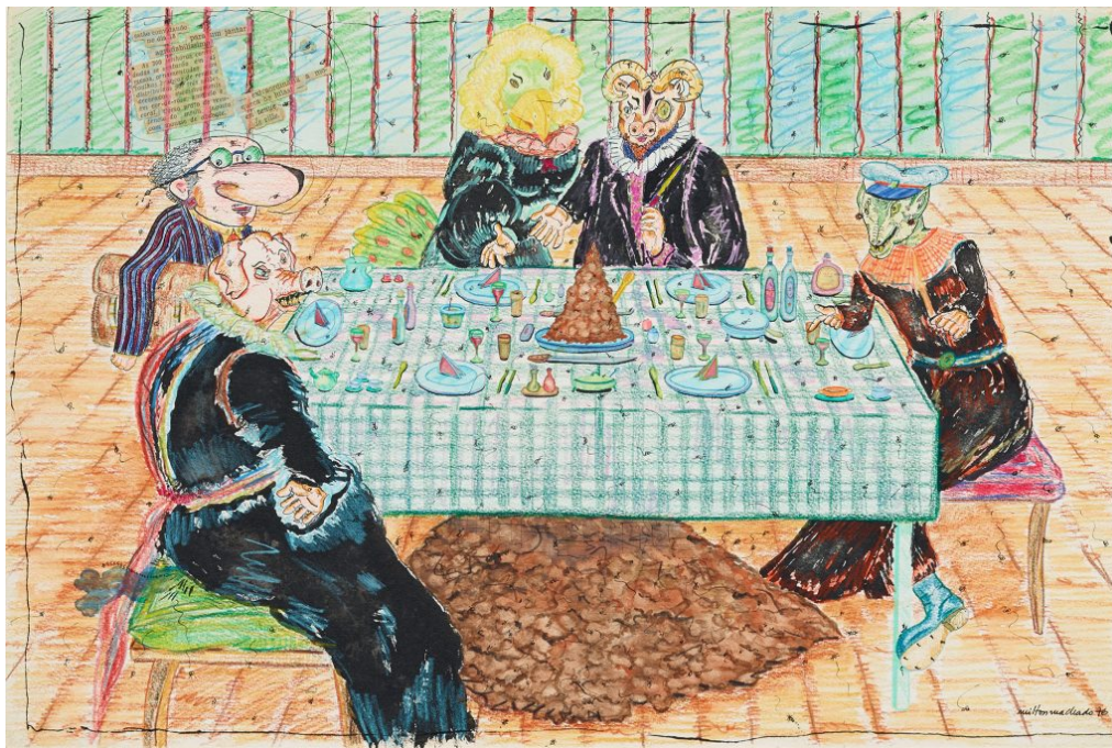
Milton Machado, Cheiro da Corte , 1976, De la serie "Desenhos raivosos", Tinta y acuarela sobre papel, 30 x 34,4 cm, Colección Daros Latinamerica, Zürich

El artista brasileño Milton Machado es otro arquitecto con grandes facultades para el diseño. También se pasó muchos años en Europa antes de volver a Río de Janeiro. Además de objetos, videos, instalaciones y esculturas arquitectónicas, su arte se centra en el dibujo, que lo ha acompañado desde siempre. Más que ningún otro medio, sus dibujos sirven para condensar y concretar unas fantasías profundamente innatas. La crítica social y política se manifestó desde sus primeros dibujos en torno a la dictadura militar. En estas obras de los años 70, dirige su ingenioso e implacable sarcasmo a las condiciones políticas que imperaban en la época y a los propios detentores del poder. Ya sea en sus "caprichos" —inspirados en los del pintor veneciano del primer Renacimiento, Vittore Carpaccio— o en sus utopías urbanas, las paráfrasis arquitectónicas de Machado fluctúan entre el pasado y la ciencia ficción; entre lo racional y lo absurdo. Impresionan por su carácter lúdico y sui generis . Son como obsesiones y mitologías privadas que emergen de un absoluto encubrimiento y con un simbolismo que, si acaso se nos revela, lo va haciendo poco a poco.