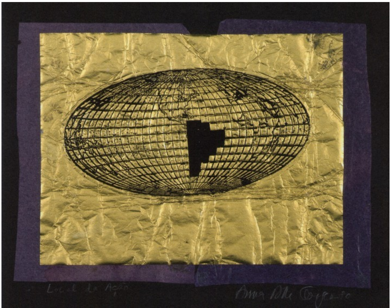
"Punto de conflicto número 1". 1979, grabado en metal sobre pan de oro. 33,5 x 39,5 cm.

–¿Cómo fue su transición desde el arte abstracto a las obras que hoy pueden verse en esta muestra?