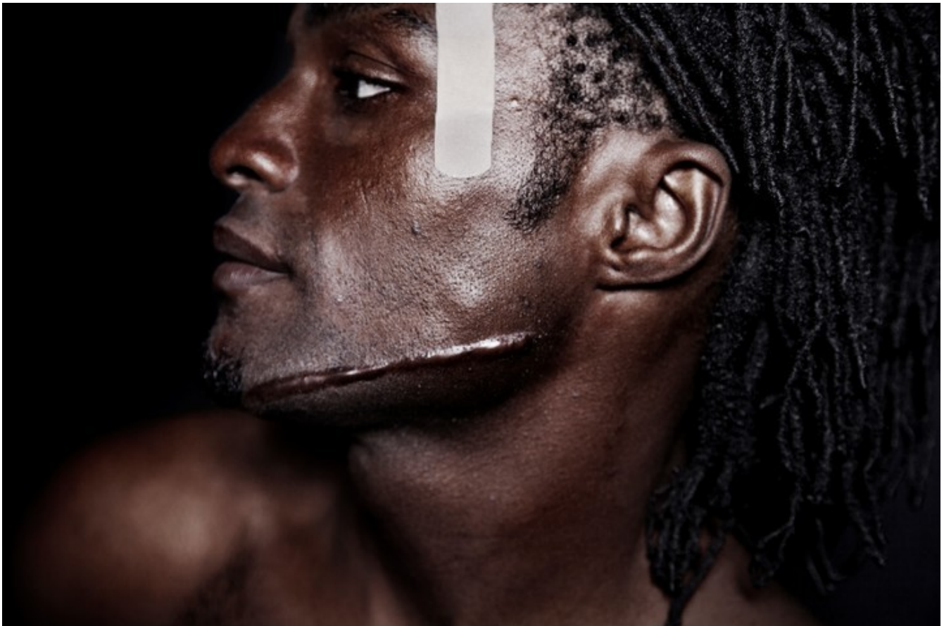
Crossings (Travesías). 2013, fotografía. 60 x 90 cm.

Para dar con el tono justo que le permita contar esa odisea de modo riguroso, sin dejar de lado cierta calidez poética, Alaoui decidió hacer cuerpo ese relato, posar sus ojos donde los posan los migrantes, mirar durante horas el agua, durante horas la arena, durante días la copa de unos árboles muy altos, esperando el mejor momento –que siempre es, en estos casos, el más seguro– para continuar camino. Ahora, en una sala a oscuras, tres pantallas alternan esas “imágenes-ojo” con los retratos filmados de los forzados viajeros.