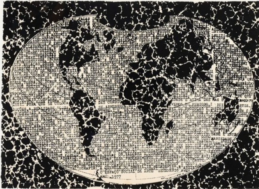
“El espacio social del arte”. 1977, serigrafía y bordado sobre lienzo. 33 x 44 cm.