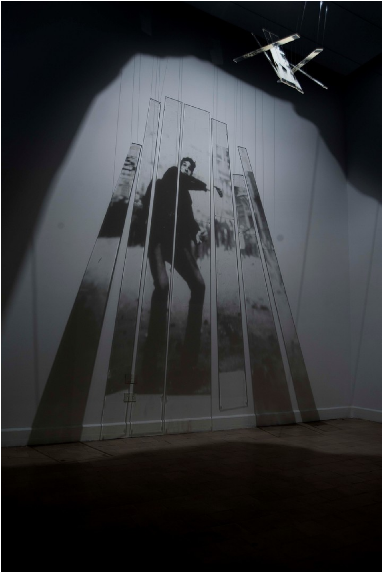
El combate perpetuo. 2001, instalación lumínica. Medidas variables.